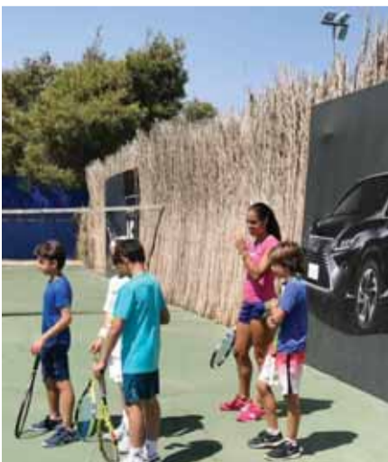
اللاعبة الإسبانية استريلا كابازا تشارك لاعبي الأكاديمية تدريباتهم

عمان - الرأي - انطلقت امس فعاليات بطولة عمان ماسترن التي تضم لأول مرة لاعبات عالميات من روسيا واسبانيا ضمن فعاليات مهرجان لكزس للتنس، الذي يقام برعاية سمو الاميرة لارا الفيصل، تنظمه أكاديمية عمان للتنس على ملاعبها بمدينة الحسين للشباب. وأكدت الاميرة لارا بان رياضة التنس للسيدات تحتاج لاهتمام كبير، وهو ما دفعنا الى استضافة لاعبات بهذا الحجم، وذلك من اجل منح الثقة للاعبه الاردنية والمنافسة مع لاعبات لهن تاريخ في هذه الرياضة. وقامت اللاعبات بجولة في الاكاديمية مع مدير عام الاكاديمية خالد فناع وشاركوا لاعبي ولاعبات الاكاديمية التمرينات بالإضافة لاجراء تدريباتهن على ملاعب الاكاديمية قبل الدخول في لقاءات البطولة. يذكر ان اللاعبة الإسبانية استريلا كابازا كان افضل ترتيب لها في المركز ٩٥، اما الروسية انستيز كوماردنيا وصلت الى ١٧٢.