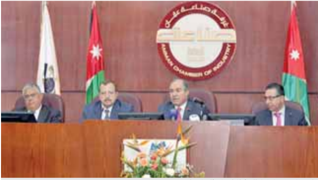
رئيس الوزراء خلال لقائه فعاليات القطاع الصناعي