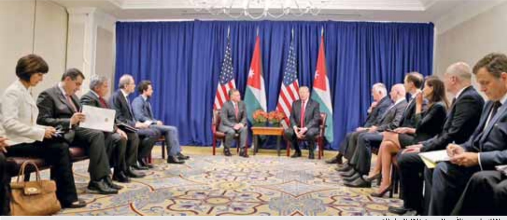
جلالته وترمب والأمير الحسين خلال المباحثات

السلطانية، استناداً إلى حل الدولتين، يفوض الأمن والاستقرار في المنطقة والعالم بأسره، ويغذي العنف والتطرف في الشرق الأوسط.