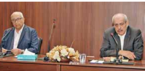
رئيس الديوان الملكي يحاضر في الشؤون الدولية