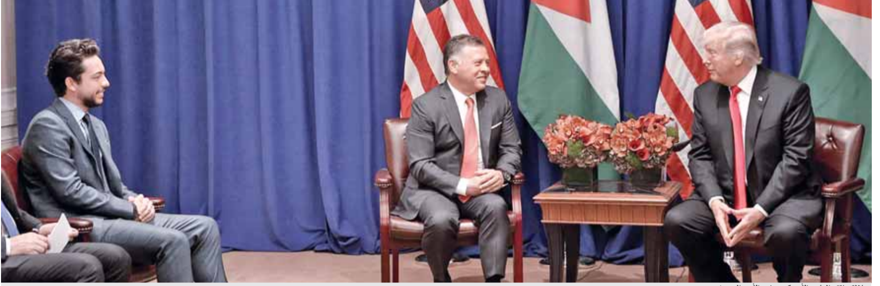
جلالته يلتقي الرئيس الأميركي بحضور الأمير الحسين

الرئيس الأميركي: الملك رجل رائع ومحارب عظيم