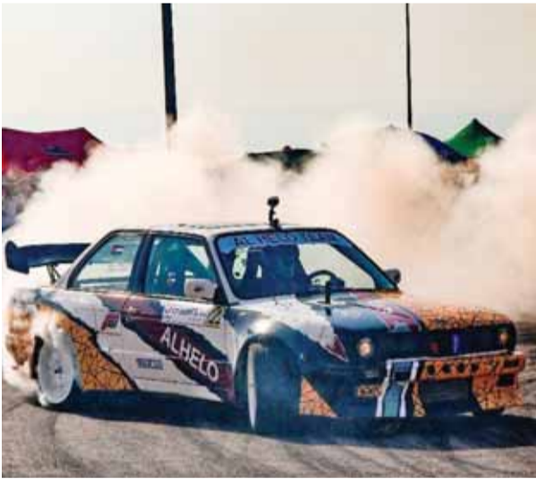
من منافسات السباق الماضي