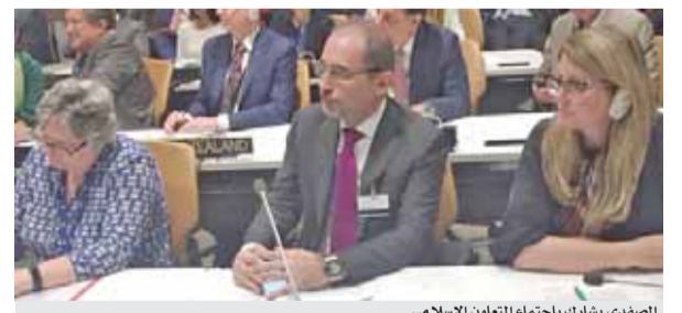
الصفدي يشارك باجتماع التعاون الاسلامي

نيويورك-بترا-شارك وزير الخارجية وشؤون المغتربين أيمن الصفدي، امس الاول الثلاثاء، في اجتماع فريق اتصال منظمة التعاون الإسلامي المعني بالروهينغيا الذي عقد على هامش أعمال الجمعية العامة للأمم المتحدة في نيويورك.