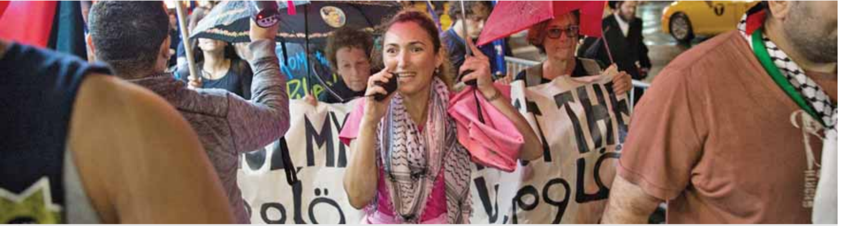
مظاهرة في نيويورك ضد نتنياهو

اقتحامات لـ «الأقصى».. ومواجهات في «أبو ديس»