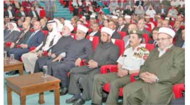
الأمير هاشم خلال رعايته الاحتفال بذكرى الهجرة النبوية الشريفة