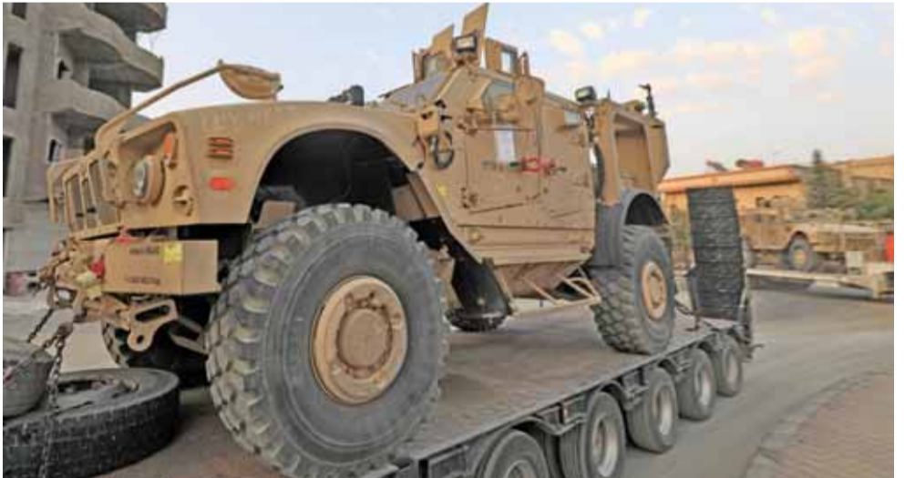
قافلة تضم مدرعات من صناعة اميركية تابعة لقوات سوريا الديمقراطية في الرقة

وكان التقدم الذي أحرزته قوات سوريا الديمقراطية على الجانب الشرقي من النهر. وأثار اللقاء حملة الجيش السوري مع عملية قوات سوريا الديمقراطية التوتر بين الجانبين. وحذرت قوات سوريا الديمقراطية يوم الاثنين من مغبة أي تقدم آخر للجيش السوري على الضفة الشرقية من النهر. وقالت وزارة الدفاع الروسية الثلاثاء إن منسوب المياه ارتفع في نهر الفرات بمجرد أن بدأ الجيش السوري في عبوره. وأضافت أن ذلك يمكن أن يحدث لسبب وحيد هو فتح السدود أعلى النهر والتي تسيطر عليها المعارضة المدعومة من الولايات المتحدة. وقال المرصد السوري إن حريقا اندلع ليل الثلاثاء في حقل غاز كونيكو واستمر حتى صباح أمس. واندلع الحريق بعدما أعلن الجيش السوري أنه يتقدم باتجاه الحقل. وقال المرصد إن اراهابيي داعش فروا من هذه المنطقة. بدورها علنت وزارة الدفاع الروسية ان القوات الجوية الروسية قتلت ٨٥٠ اراهابيا في سوريا في الساعات الأربع والعشرين الماضية