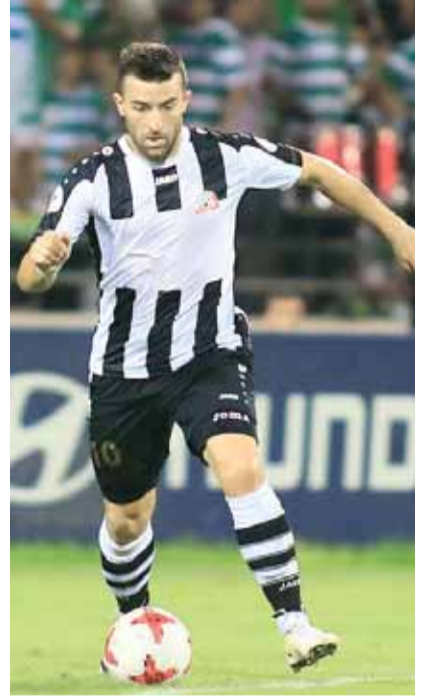
بويان (شباب الأردن)

تحصيل النقاط والابتعاد عن الخسائر هو الأهم في البداية، حالنا كحال باقي الفرق نبحت عن الفوز دائماً، لكن طبيعة المباريات وقوة الفريق المنافس تجبرك أحياناً على تغيير الأسماء وطريقة الأداء وصولاً الى الهدف المطلوب.. وبالنسبة لتشكيلة فإننا نبحت عن التجانس وقد يكون هناك تغيير لكن دون مبالغة في الهجوم.