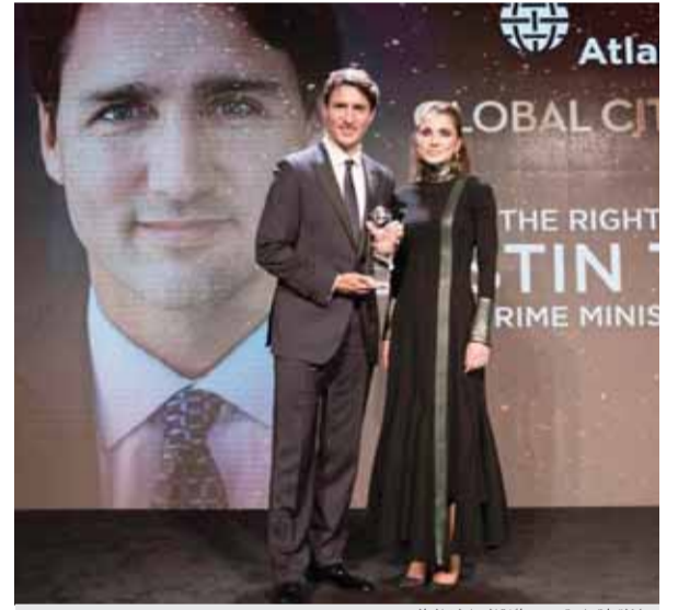
جلالته تسلم ترودو جائزة المواطن العالمي

عمان - بترا - سلمت جلالة الملكة رانيا العبدالله، امس الاول في نيويورك، جائزة المواطن العالمي لرئيس الوزراء الكندي جاستن ترودو، والتي قدمها «مجلس الثلاثين»، الذي يعتبر أحد أبرز المؤسسات المعنية بمجال الشؤون الدولية. وقالت جلالته، بحضور ٤٥٠ شخصية، إنه في الوقت الذي تحتفل فيه كندا بالذكرى الـ ١٥٠ على تأسيسها، يقودها ترودو لتجديد قيمها العميقة في الانفتاح والكرام والعطف وسعة الاقفا، والتي يحترم لأجلها الكنديون حول العالم.