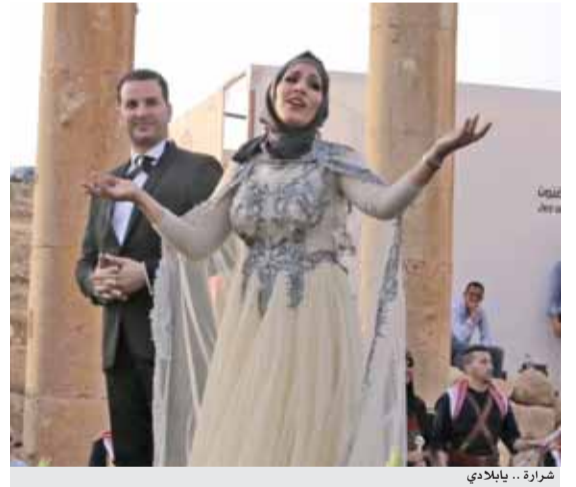
شرارة .. يا بلادي