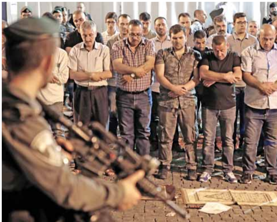
(١ ف ب)