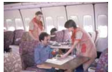
شركة الخطوط الجوية «عالية» في أوائل سبعينيات القرن الماضي