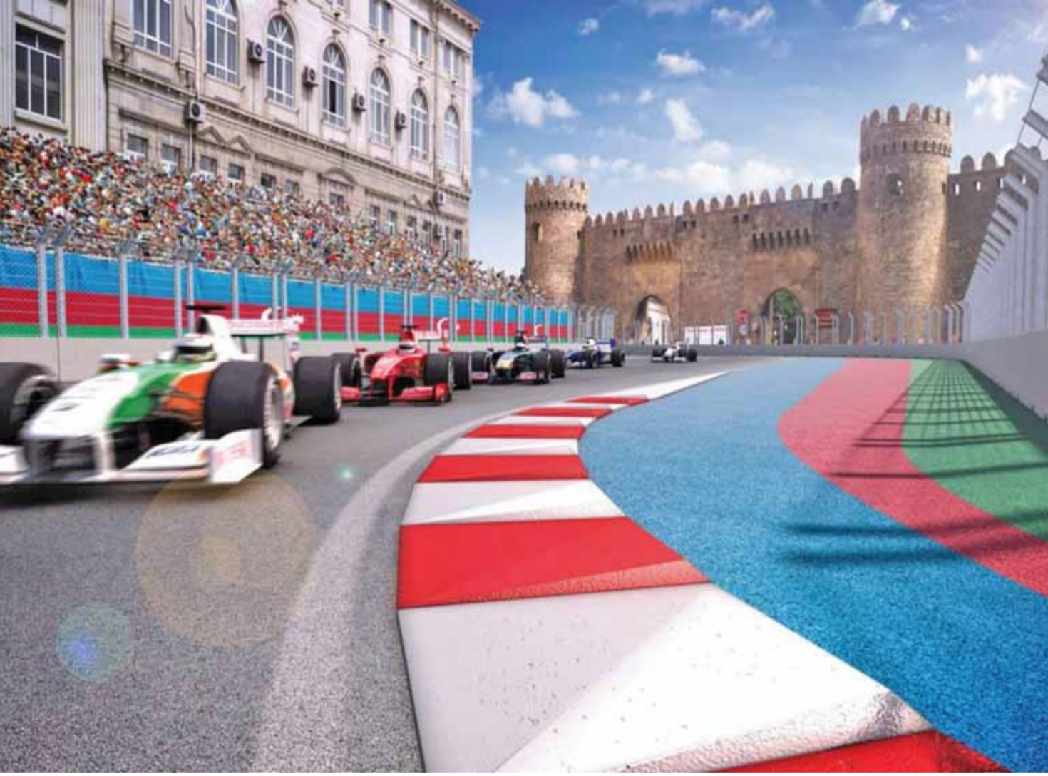
حلبة باكو في ادريجان

ولم تكن مشاركة هاميلتون في السباق الافتتاحي لبأكو العام الماضي جيدة فقد اصطدمت سيارته بأحد الجدران على الحلبة ليكتفي بالمركز الخامس في حين توج زميله المعتزل الالماني نيكو روزبرج بالمركز الأول. وقال هاميلتون «كنت سعيدا العام الماضي على هذه الحلبة، لكنني لم احقق النتيجة المرجوة. وبالتالي فان هدفي في هذه المرة هو تحقيق نتيجة ايجابية..» واشاد به وولف بقوله «بيدو لويس في افضل وضعية له منذ خمس سنوات تاريخ انضمامي الى الفريق، ليس فقط بسبب النتيجة الأخيرة في مونترال، بل لانه يتألق جيدا مع الايام الصعبة..» وتعتبر حلبة باكو ثاني اطول حلبة بعد سبا فرانكورشان البلجيكية حيث تمتد على اكثر من ستة كيلومترات..»