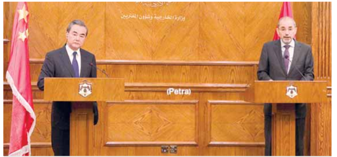
الوزير الخارجية وشؤون المغتربين

عمان - رهام فاخوري - جدد الأردن والصين تأكيداً لضرورة الحل السياسي للأزمة في سوريا، وأن «لا حل عسكرياً لها»، مؤملياً ان تحل الأزمة الخليجية الراهنة داخل البيت الخليجي، وشدا على ان مركزية القضية الفلسطينية وحلها مفتاح لحل أزمات المنطقة. وأوضح وزير الخارجية وشؤون المغتربين أيمن الصفدي في مؤتمر صحفي عقده ونظيره الصيني وانج يي في مبنى الخارجية امس أن الأردن والصين يؤمنان بأن حل الازمات في الشرق الاوسط يجب ان يتم سياسيا، بعيدا عن الحلول العسكرية. وأوضح أن الاردن يعمل مع مختلف الأطراف بما فيها الصين لحل الأزمة في سوريا ووقف القتال، وضرورة الانتقال للحل السياسي. وقال الزين أن قرار المحكمة جاء بناء على دعوى رفعتها لجنة شؤون الأحزاب السياسية في الوزارة وفقاً لأحكام المادة ٣٤ / أ البند ٤ من قانون الأحزاب السياسية النافذ. ولفت إلى أن الوزارة وانطلاقاً من رؤيتها ورسالتها ملتزمة بتقديم جميع أشكال الدعم والتسهيلات اللازمة للأحزاب المرخصة لتحقيق أهدافها وغاياتها التي أسست من أجلها، مع إعطاء