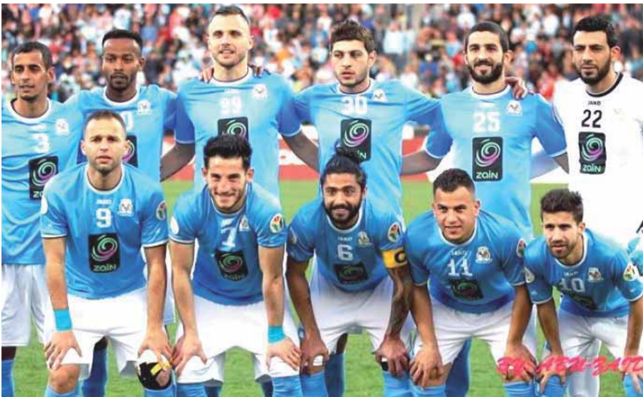
فريق الفيصلي لكرة القدم

وتستمر مواجهات الدور الأول، التي تقام من دوري بمرحلة واحدة حتى الأحد ٣٠ تموز، على أن تحصل بعدها المجموعة المتأهلة إلى نصف النهائي، على راحة يومين . ويتأهل للدور نصف النهائي الفرق أصحاب المراكز الأولى بالمجموعات الثلاث، بالإضافة إلى الفريق صاحب أفضل مركز ثان بالمجموعات الثلاث، على أن تجري قرعة بين الفرق الأربعة. وتقام مباراتي الدور نصف النهائي في ٢ آب، فيما تقام المباراة النهائية يوم ٥ آب.