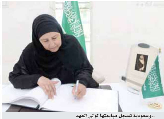
..سعودية تسجل مبايعتها لولي العهد