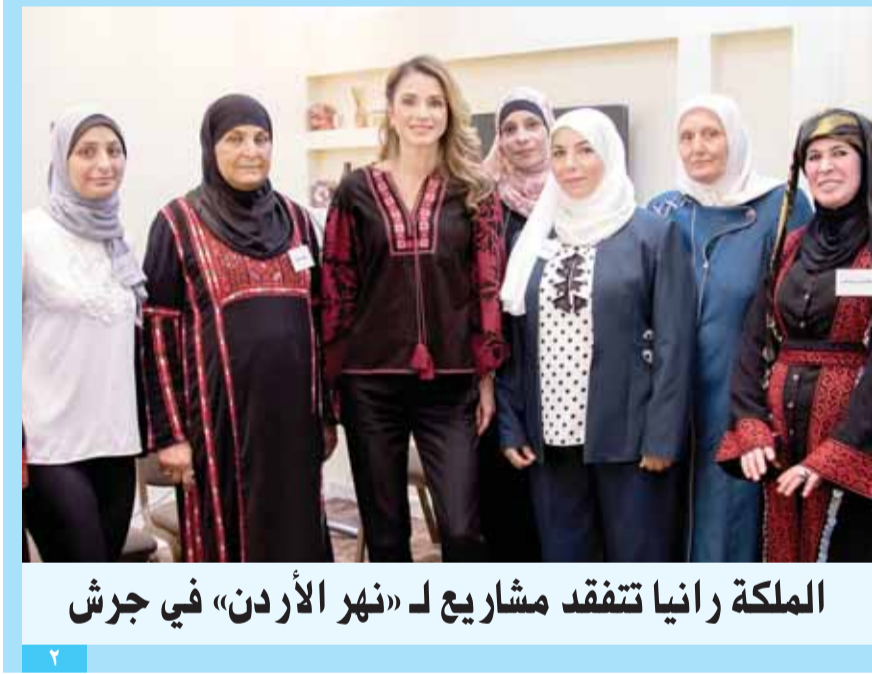
الملكة رانيا تتفقد مشاريع لـ «نهر الأردن» في جرش

تفويض موظفين بـ «الزراعة» صفة الضابطة العدلية عمان - لانا الظاهر - قرر وزير الزراعة المهندس خالد الحنيفات تفويض صلاحياته لصفة الضابطة العدلية لمجموعة من المعنيين في الوزارة استناداً لأحكام المادة (٦٣) من قانون الزراعة رقم (١٣) لسنة ٢٠١٥ و تعديلاته في تطبيق تعليمات ضبط جودة الخضار والفواكه الطازجة وتعليمات مراكز تدرج وتعبئة الخضار والفواكه وكذلك تعليمات النقل المبرد وتعليمات اتلاف الخضار والفواكه غير الصالحة بالإضافة لتعليمات ترخيص مخازن تبريد المنتجات الزراعية للتسويق. (التتمة صه)