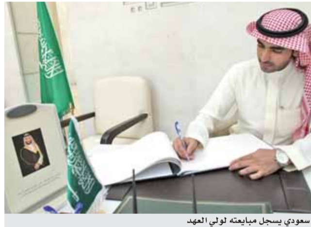
سعودي يسجل مبايعته لولي العهد

عمان - الرأي - شهدت السفارة السعودية في عمان أمس توافد العديد من السعوديين المقيمين والزائرين يتقدمهم أعضاء السفارة والملحقيات والمكاتب التابعة لها والطلبة والطالبات الدارسين في الأردن لمبايعة الأمير محمد بن سلمان بن عبد العزيز آل سعود ولياً للعهد، وناثيا لرئيس مجلس الوزراء ووزيراً للدفاع «على السمع والطاعة في المنشط والمكره وذلك طاعة لله ورسوله وانفاذاً لتوجيهات خادم الحرمين الشريفين الملك سلمان بن عبد العزيز آل سعود».