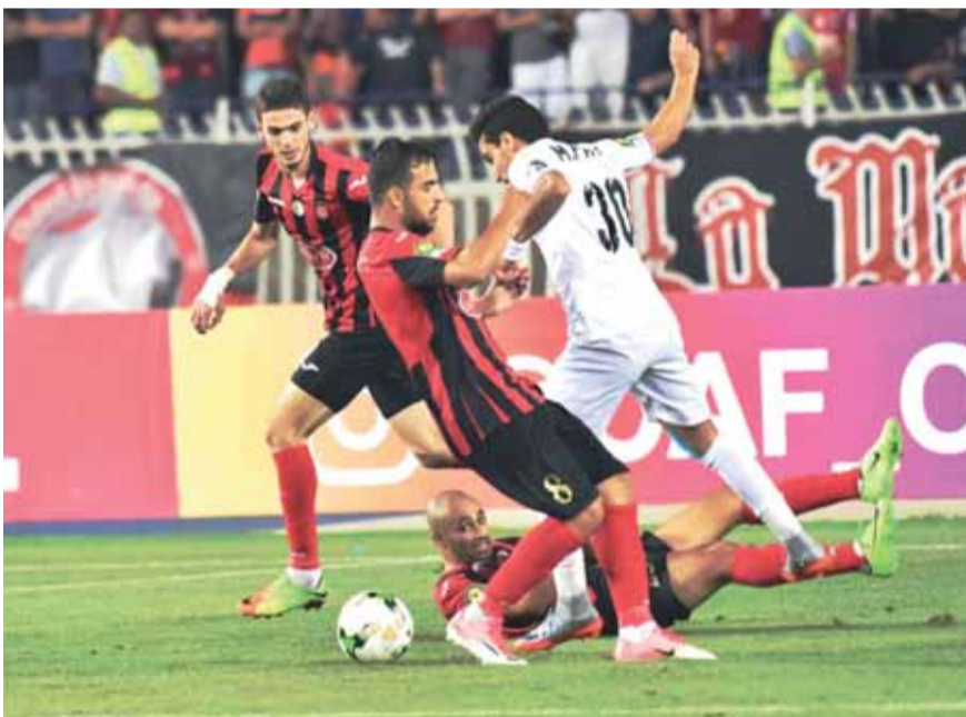
ندية واضحة طغت على اللقاء

يذكر بأن الفيصلي سيواجه الأهلي المصري عند التاسعة مساءً ٢١ تموز على ستاد على السلام في القاهرة ضمن المجموعة الأولى، في حين يلتقي الوحدة الإماراتي، ونصر حسين داي الجزائري بذات المجموعة في اليوم التالي، على