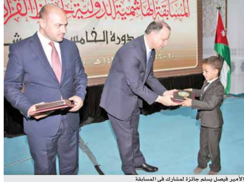
الأمير فيصل يسلم جائزة لمشارك في المسابقة