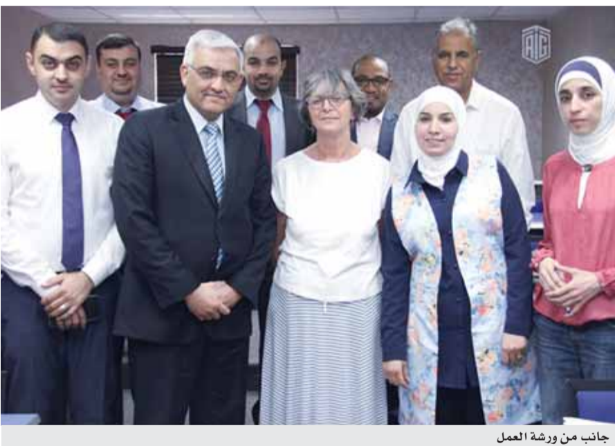
جانب من ورشة العمل

عـمان - بتر - باشرت مجموعة طلال أبو غزالة من خلال أكاديمية أبو غزالة للتدريب بالاستعداد لعقد دورات وامتحانات «مؤهلات كامبردج» للغة الإنجليزية، التابعة لجامعة كامبردج. وعقدت الأكاديمية بالتعاون مع جامعة كامبردج دورة تأهيلية لمجموعة من المتخصصين في اللغة الإنجليزية، لإعدادهم كممتحنين معتمدين لديها لتنفيذ الجزء الخاص بامتحان المحادثة في اللغة الإنجليزية للمشاركين في الدورات التدريبية التي ستعقدها المجموعة خلال الفترة القادمة.