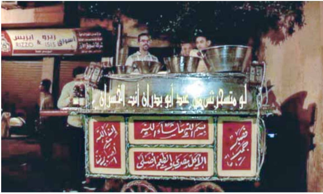
القول والخبز البلدي سحور اهل مصر