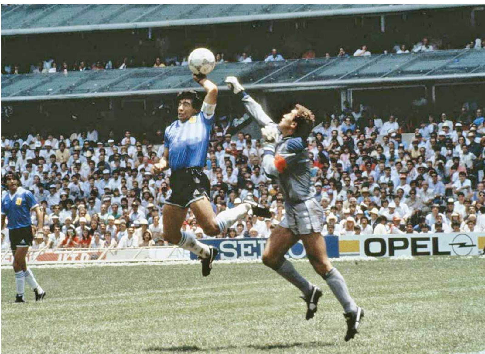
الهدف الشهير لمارادونا بيده أمام إنجلترا ١٩٨٦

عمان - الرأي - فترة رياضية رمضانية، نطل بها عليكم لتستذكروا، بعض المشاهد العالمية من مباريات وأحداث كروية راسخة في الأذهان وعالقة في الذاكرة، رصدتها -الرأي- للقاء.