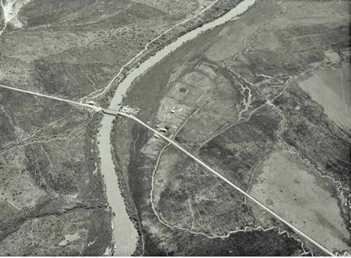
نهر الأردن وجسر الملك حسين والصورة تعود لعام ١٩٣١

تتشرب ابواب - الرأي مجموعة من المقتنيات المهمة من الصور الفوتوغرافية والوثائق التي تقوم على دراستها وارشفتها دائرة المكتبة الوطنية، وتشكل مفردات مهمة من ذاكرتنا الوطنية.