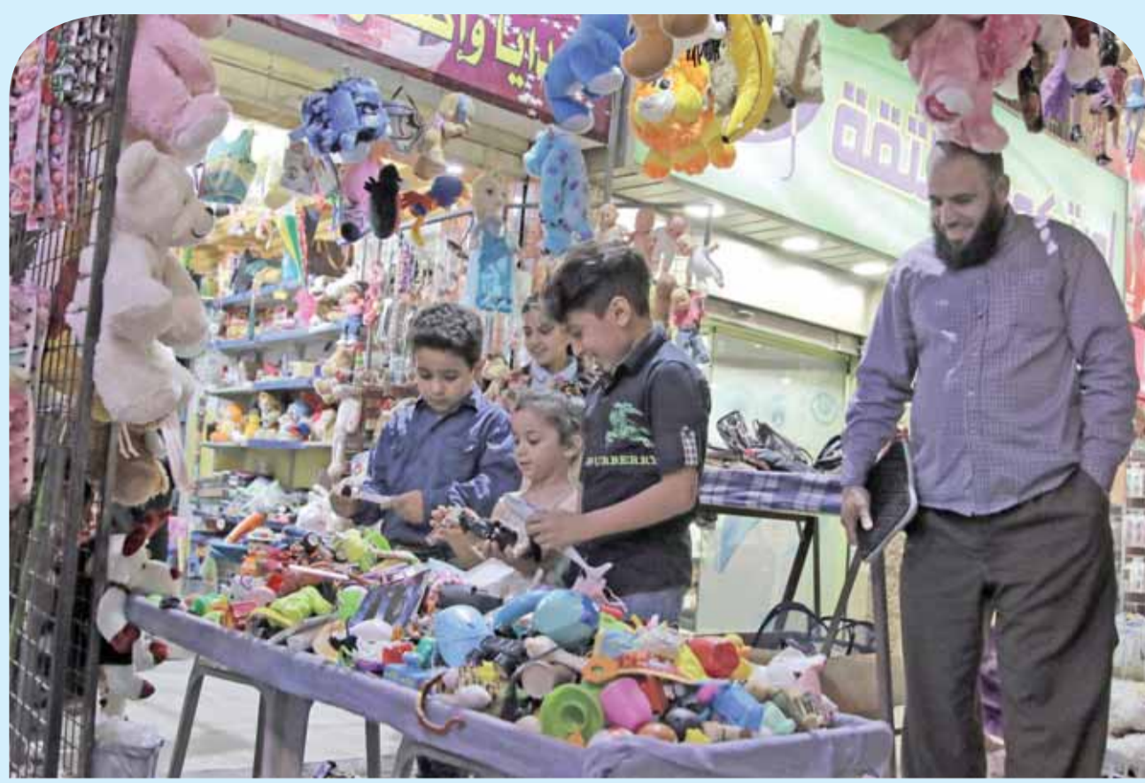
ابتداء عيدهم، يقبلون الألعاب بعيون الإندهاش والبهجة ويستغرقهم الوقت، فكانهم يريدونها جميعها دفعة واحدة. هكذا الطفولة لا تعرف ما نسميه «الموازنة» ولا أحد سواهم يحب الحياة حبا حقيقيا.