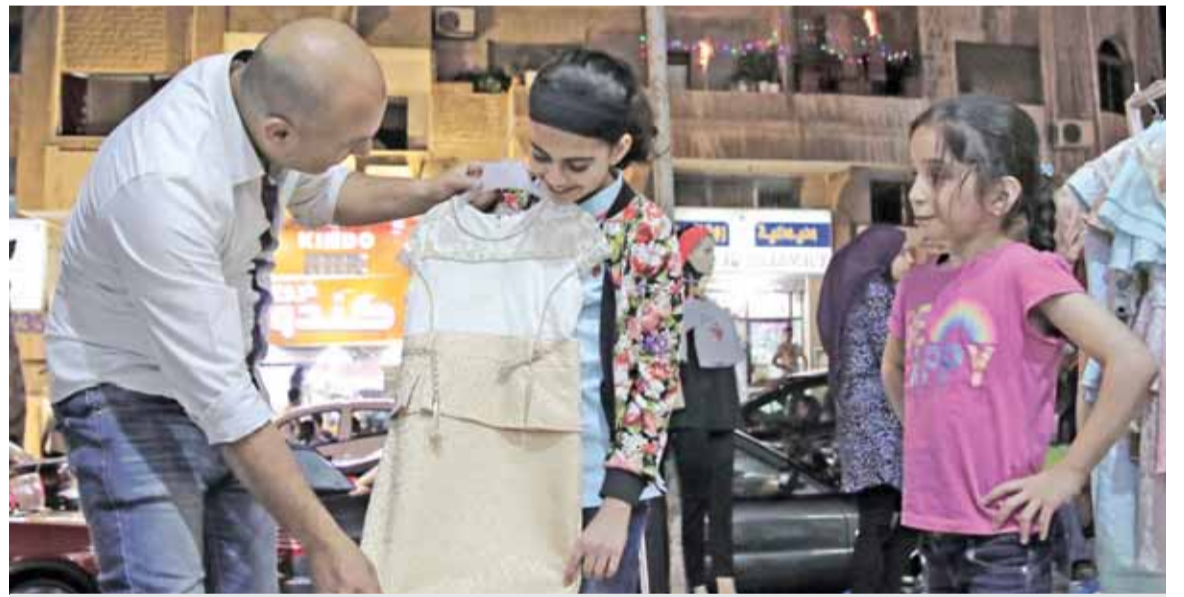
توقعات بارتفاع الطلب على الألبسة خلال الأيام الثلاثة القادمة