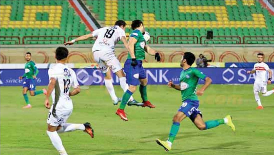
الزمالك ومصر المقاصة... تعاد بقرار قضائي

القاهرة - أف ب - حكم القضاء الإداري المصري بإعادة مباراة الزمالك والمقاصة، التي كانت مقررة ضمن المرحلة الثانية والعشرين من الدوري المصري لكرة القدم وانسحب منها الأول اعتراضا على موعد اقامتها. وأصدرت المحكمة قرارها النهائي بشأن الدعوى القضائية التي رفعها مجلس إدارة الزمالك برئاسة مرتضى منصور بقبول الدعوى التي قدمها مسؤولو النادي بإعادة المباراة. واختصم مسؤولو الزمالك فيها كلا من خالد عبد العزيز وزير الشباب والرياضة وهاني ابو ريدة رئيس اتحاد كرة القدم ومحمد سويلم مدير مديرية الشباب والرياضة بالقاهرة،