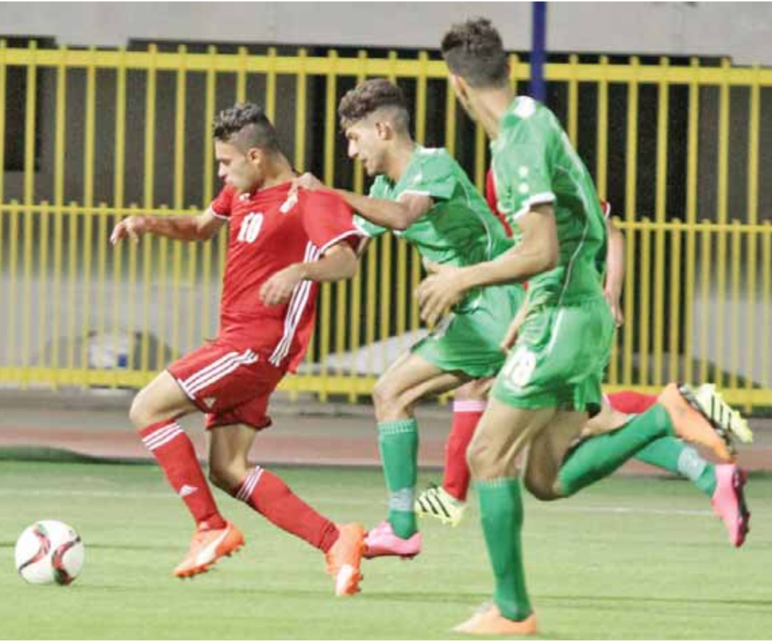
تعدال مع نظيره العراقي