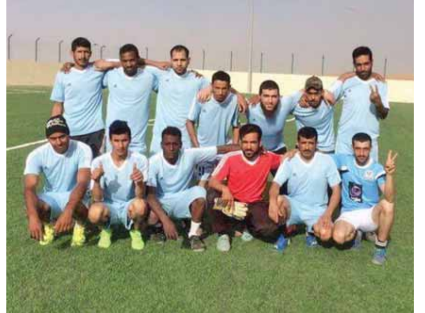
فريق شباب القطرانة