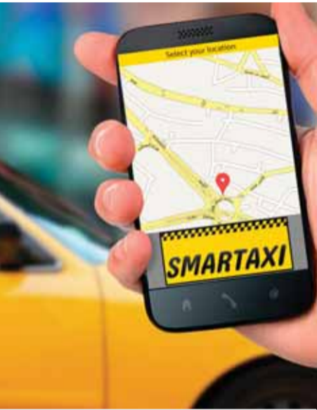
مجاهد : التعليمات يمكن مراجعتها