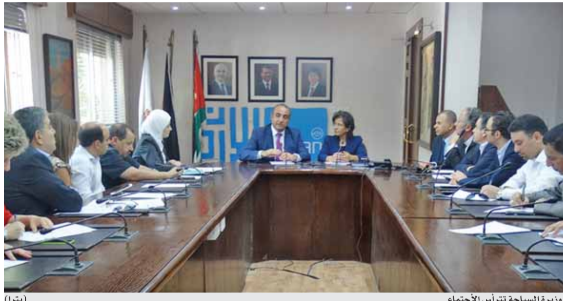
وزيرة السياحة تتراس الاجتماع