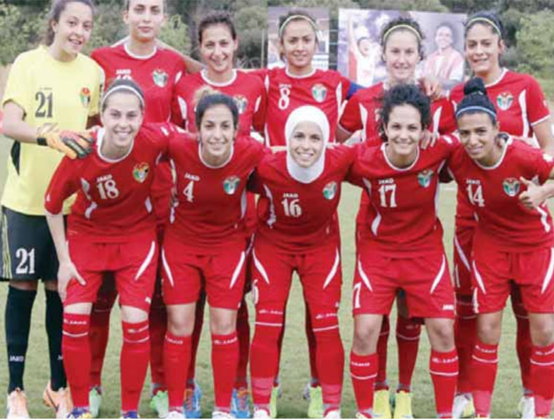
المنتخب النسوي يبدأ تجمعه

عمان - الرأي - بدأ أمس المنتخب النسوي لكرة القدم تجمعه الأول بعد انتهاء منافسات الدوري بقيادة المدير الفني الجديد الأميركي مايكل ديكي، وذلك استعداداً لملاقاة الجزائر ودياً مرتين في عمان منتصف الشهر المقبل. وتأتي المباراتين ضمن تحضيرات المنتخب للمشاركة في نهائيات كأس آسيا للسيدات التي يستضيفها الأردن في نيسان العام المقبل والمؤهلة لنهائيات كأس العالم للسيدات فرنسا ٢٠١٩، حيث سيدخل المنتخب النسوي معسكراً تدريبياً مغلِقاً في أحد فنادق عمان تأهباً للقاءين.