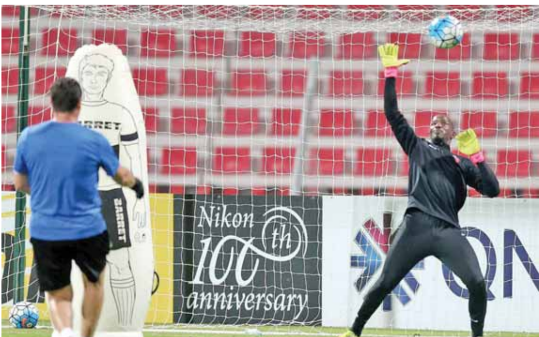
مدربيات الأهلي الإماراتي

يقتلح العين الاماراتي الى تعويض خسارته ذهابا امام استقلال طهران الإيراني ١-٠ عندما يستضيفه اليوم على ملعب هزاع بن زايد. وكان العين الطرف الافضل في المباراة التي اقيمت على ستاد ازادي قبل ان يتلقى مرمها هدفا مفاجئا عبر ركلة جزاء في الدقيقة الثانية من الوقت البديل.