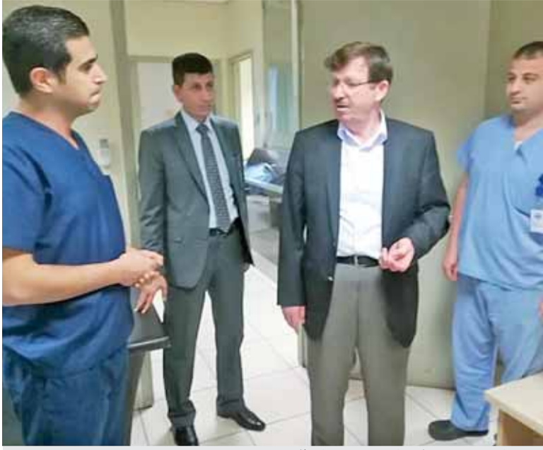
وزير الصحة خلال زيارته لمركز صحي المطار

بدوره، ثمن رئيس محكمة التمييز رئيس المجلس القضائي محمد الغزوي الدعم المستمر الذي تحظى به السلطة القضائية من قبل جلالة الملك عبد الله الثاني، مؤكداً أن القضاء يشكل ركناً أساسياً من أركان مسيرة الإصلاح الشامل في مختلف المجالات السياسية والاقتصادية والاجتماعية.