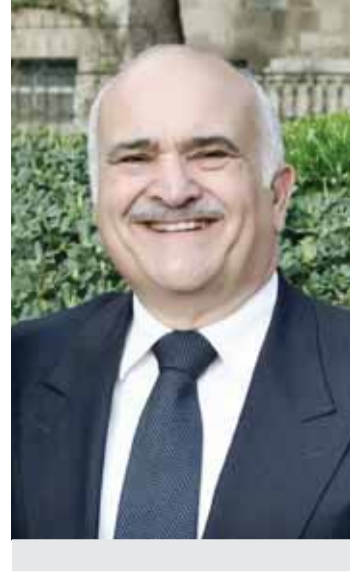
كارثية تُعمي الأبصار عن إنسانية الآخر، وتحط من شأننا أمام الله والبشرية جمعاء، كما أنها العدو الطبيعي للسلام

الشر الخبيث أن يضعف من عزيمتنا. من المحزن، أن الجماعة التي ارتكبت القفازات الأخيرة قد انحرفت عن المسار