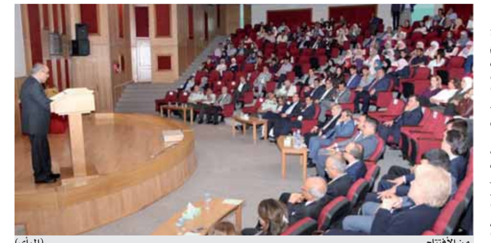
من الافتتاح (الرأي)

يقدمها خبراء في هذا المجال من المملكة المتحدة وإيطاليا والأردن، الأمر الذي يؤكد عزم الكلية بضرورة الاستفادة من تلك المستجدات وتوظيفها في ممارسة المهنة.