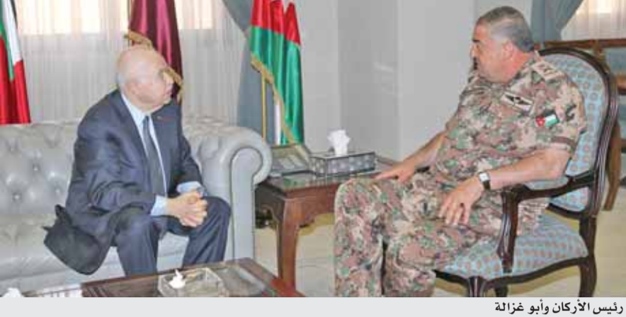
رئيس الأركان وأبو غزالة

عمان - بترا - بحث رئيس هيئة الأركان المشتركة الفريق الركن محمود عبد الحليم فريحات، مع رئيس مجموعة طلال ابو غزالة الدولية الدكتور طلال ابو غزالة والوفد المرافق، إنشاء محطات المعرفة وإمكاناتها المتقدمة في مجالات التدريب الفني والمهني، وقامت المجموعة بإنشاء محطة معرفة في وحدة الامن والحماية، وساهمت بإنشاء قاعة الشهداء