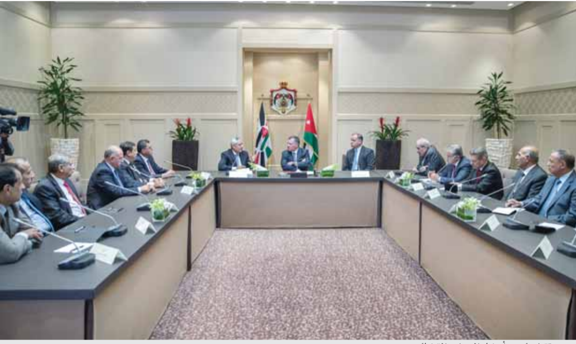
.. ويستقبل رئيس وأعضاء المجلس القضائي