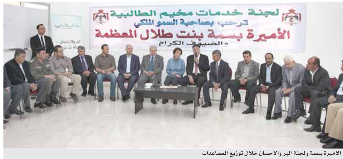
الاميرة بسمة ولجنة البر والاحسان خلال توزيع المساعدات

وأكدت سموها خلال تسليم المساعدات على الرسالة الانسانية النبيلة لحملة البر والإحسان، وحرصها بمساعدة الخيرين والداعمين، على الوصول للفئات المستهدفة في مختلف مناطق المملكة، لافتة إلى أن ما تقوم به الحملة يعكس صور