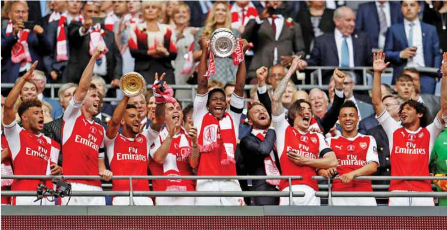
لاعبو ارسنال لحظة تسلمهم الكأس على منصة التتويج

وصمد سانثيس مبكرا لاعبي تشيلسي بكررة لعبها