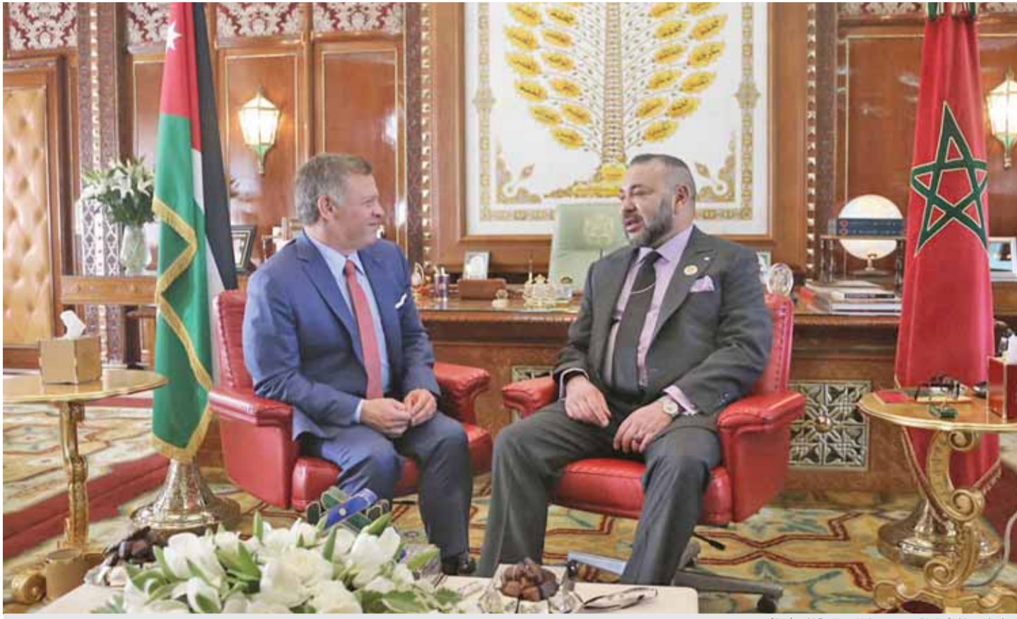
جلالته والعاقل المغربي خلال جلسة المباحثات