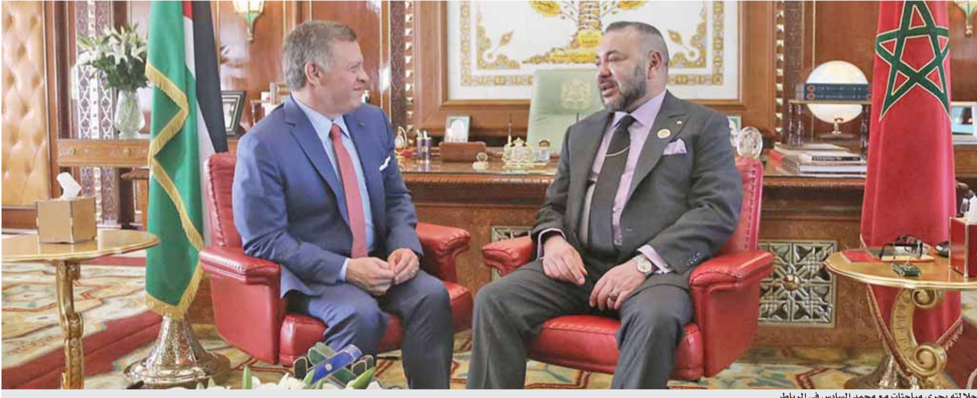
جلالته يجري مباحثات مع محمد السادس في الرباط

الرباط - بترا - أجرى جلالة الملك عبدالله الثاني وأخوه جلالة الملك محمد السادس، ملك المملكة المغربية، مباحثات في الرباط أمس، تناولت تعزيز العلاقات الأخوية والتاريخية بين الأردن والمغرب، والأوضاع في الشرق الأوسط. وأكد جلالتهما، أهمية أن تفضي القمة العربية، التي يستضيفها الأردن أواخر الشهر الحالي، إلى بلورة رؤية عربية مشتركة لمعالجة الأزمات والتعامل مع التحديات التي تمر بها المنطقة العربية.