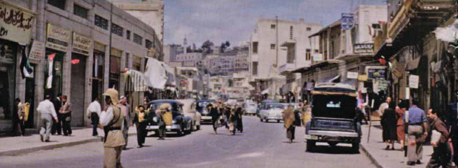
شارع الرضا وسط عمان في خمسينيات القرن الماضي.