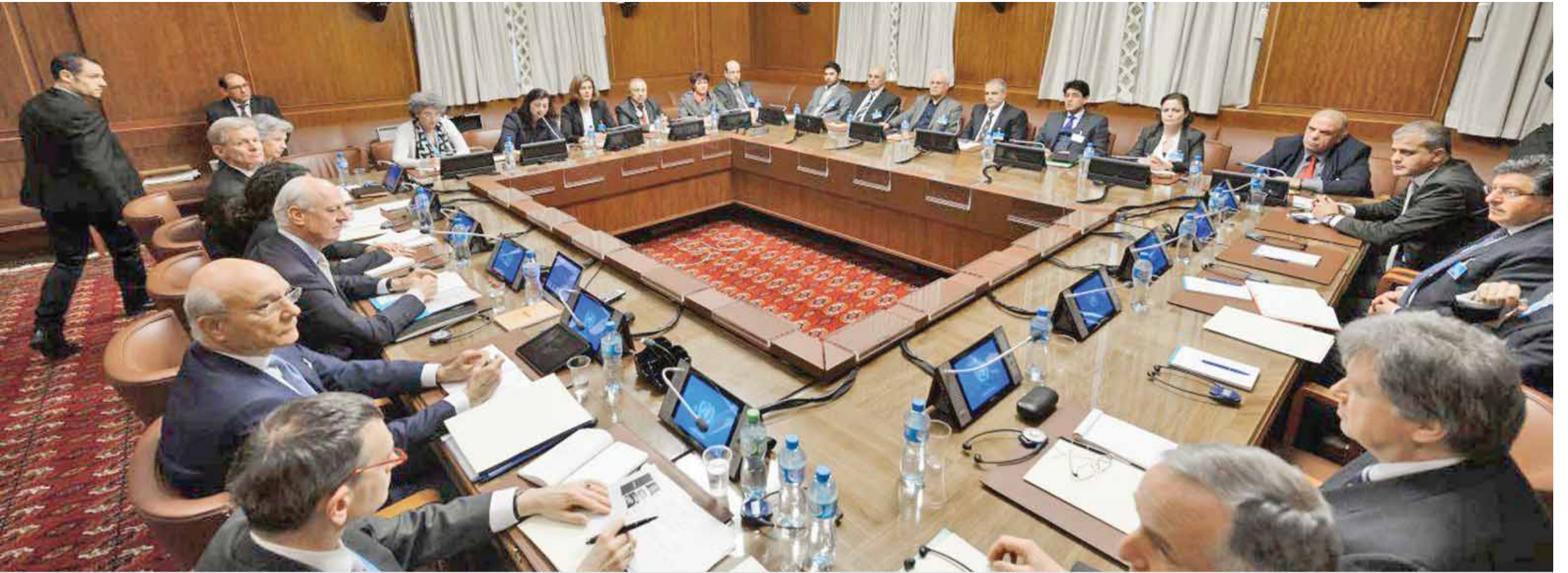
من مباحثات السلام السورية في جنيف