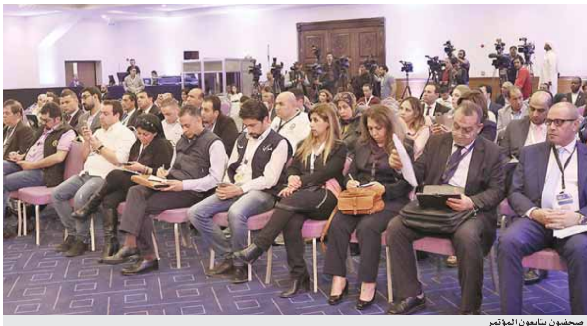
صحفيون يتابعون المؤتمر

وأشار المومني إلى حضور الأمين العام للأمم المتحدة والعديد من الضيوف الدوليين، وممثلاً للرئيس الروسي، حيث تتمتع روسيا بعلاقات ومصالح جيدة مع العديد من الدول العربية، الجلسة الافتتاحية للقمة.