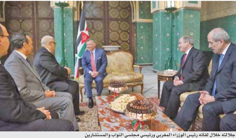
جلالته خلال لقائه رئيس الوزراء المغربي ورئيسي مجلسي النواب والمستشارين

المباحثات ركزت على سبل توسيع آفاق التعاون بين البلدين، والبناء على نتائج اجتماعات اللجنة العليا الأردنية المغربية المشتركة التي عقدت في الرباط العام الماضي، بما يسهم في بناء شراكة استراتيجية بينهما. كما أكد الزعيمان الحرص على إدانة التنسيق والتشاور حيال مختلف التحديات التي تواجه المنطقة، خدمة لتضايي الأمة العربية وتحقيقا لأمن واستقرار شعوبها. وخلال المباحثات، أعرب جلالته الملك عبد الله الثاني عن خالص التهاني لأخيه جلالته الملك محمد السادس بمناسبة انضمام بلاده مجددا إلى الاتحاد الأفريقي. وتطرقت مباحثات الزعيمين إلى أبرز القضايا التي ستبحثها القمة العربية، وفي مقدمتها عملية السلام والقدس، والمصالحة الوطنية العراقية، وتطورات