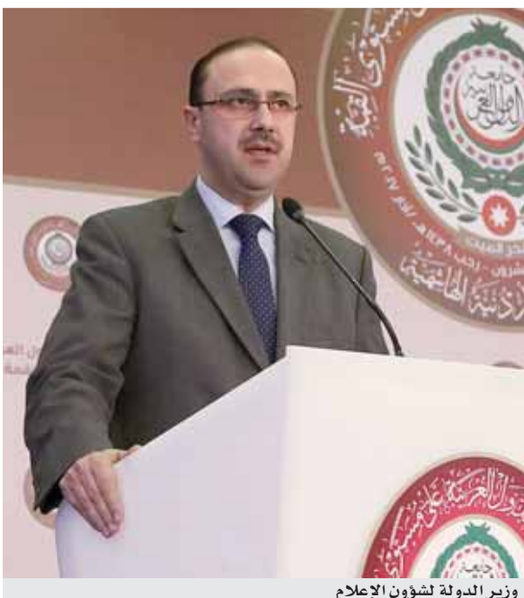
وزير الدولة لشؤون الإعلام

وأشار المومني إلى حضور الأمين العام للأمم المتحدة والعديد من الضيوف الدوليين، وممثلاً للرئيس الروسي، حيث تتمتع روسيا بعلاقات ومصالح جيدة مع العديد من الدول العربية، الجلسة الافتتاحية للقمة.