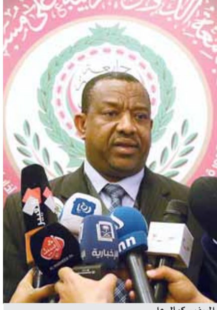
السفير كمال علي