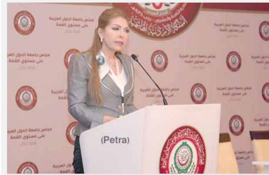
السفيرة علاء الدين

واضافت انه تم ايضا مناقشة الاستراتيجية العربية للبحث العلمي والتكنولوجي والابتكار اضافة الى خطة عمل الاستراتيجية التنفيذية بعنوان، اجندة تنمية المرأة في المنطقة العربية للفترة ٢٠٢٠-٢٠٣٠، والية تنفيذ مبادرة رئيس جمهورية السودان للاستثمار الزراعي العربي في السودان للمساهمة في سد الفجوة الغذائية وتحقيق الامن الغذائي العربي.