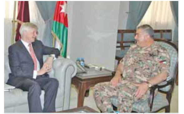
رئيس هيئة الأركان منلتيقا السفير البريطاني (بترا)

وبيّن انه سيصار الى تعزيز المستشفى باحتياجاته من الكوادر الطبية والتمريضية والفنية التي يحتاجها، مشيراً الى ان الكادر الحالي يتناسب بشكل مقبول مع عدد الاسرة الا انه أكد ان الضغط