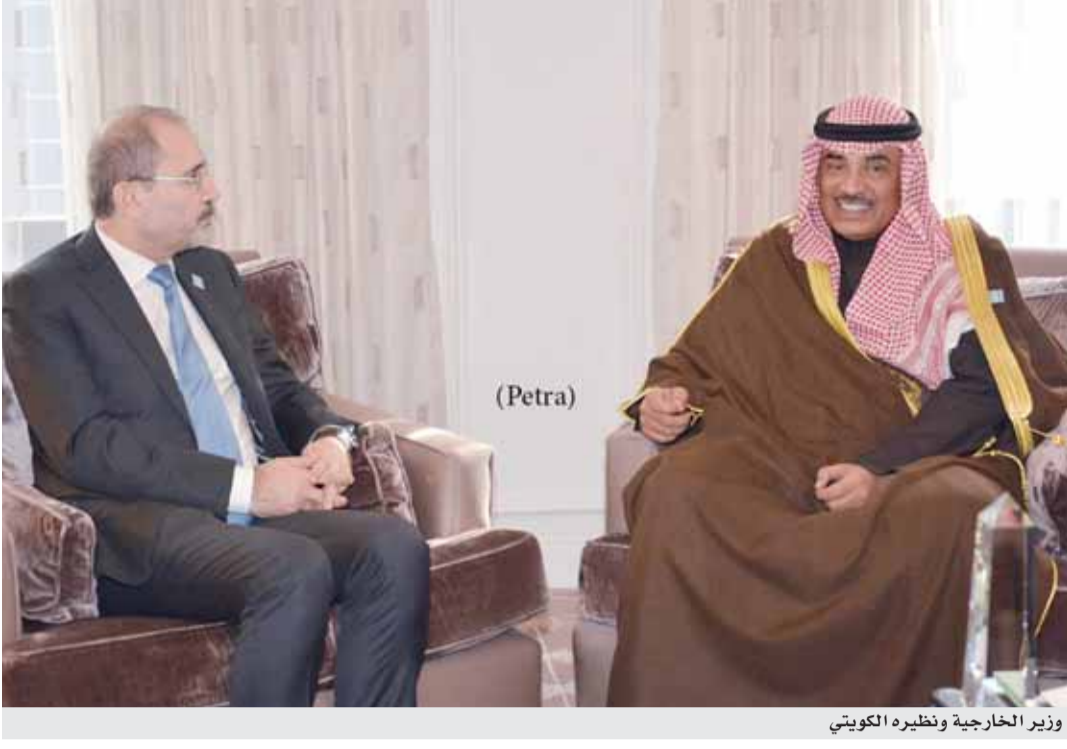
وزير الخارجية ونظيره الكويتي