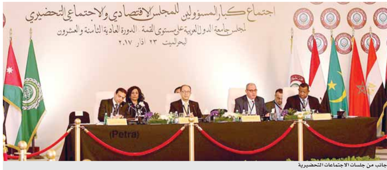
جانب من جلسات الاجتماعات التحضيرية

المومني: أهمية سياسية واقتصادية كبيرة للقمة